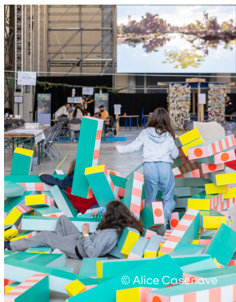
«Appareillage palace» - Oeuvre-jeu de Pinaffo-Pluvinage