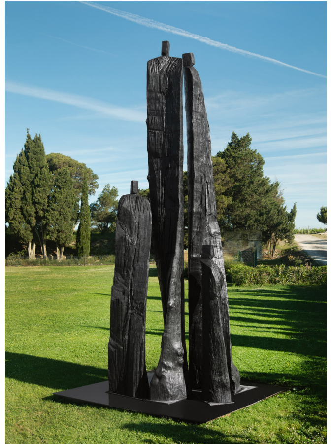
Christian Lapie Les Figures du Monde 2022

Avec RockStoneShift , Arik Levy explore la tension entre la perception et la réalité. La forme fragmentée de la sculpture interpelle l'esprit du spectateur, déclenchant un désir inconscient de compléter et d'unir ses deux parties distinctes. Ce décalage perceptuel crée une illusion de mouvement cinématique, malgré l'immobilité physique de la sculpture. Cette œuvre explore la relation complexe entre l'espace, le spectateur et la réflexion. Ses facettes angulaires déforment et reconstruisent l'environnement, générant une réalité optique qui défie les limites de la vision humaine. Les deux sections décalées et tournées interagissent de manière dynamique, produisant des reflets fragmentés qui ne peuvent être vus ou composés à l'œil nu. La réalité est présente, mais insaisissable, familière, mais nouvellement assemblée. La série de sculptures RockStone a commencé comme un monolithe, entre l'héritage de Stonehenge et l'architecture contemporaine. Les œuvres de l'artiste sont également à découvrir dans son parc de sculptures à Saint Paul de Vence.