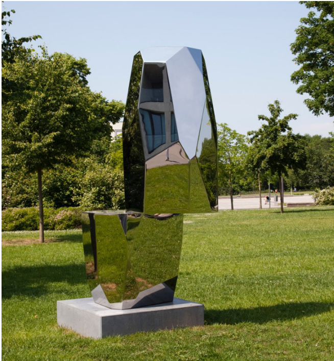
Arik Levy RockStoneShift 235 2017

Acier inoxydable poli miroir qualité marine 120 x 115 x 235 cm Courtesy de l'artiste © Arik Levy