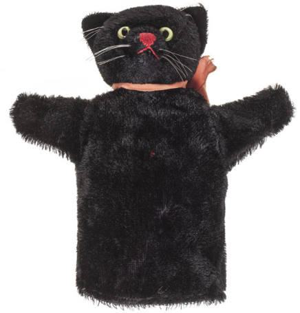
Black Tom, Steiff, vers 1960 Peluche, mohair, verre, velours brodé Paris, musée des Arts décoratifs