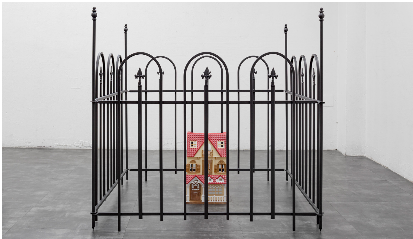
Debora Delmar, Residence II , 2022, Courtesy de l'artiste et Galleria Piu © Stefano Maniero

Comme dans les rayons d'un grand magasin, les jouets se suivent mais ne se ressemblent pas. Troisième exposition du Hangar Y et deuxième proposée par la Fondation Art Explora, Rayon Jouets est à destination de tous les publics. L'exposition rassemble certains des plus anciens jouets retrouvés dans le monde, aux côtés de pièces récentes pensées par des artistes contemporains de la scène internationale.