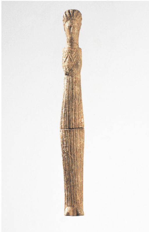
Poupée, II e -VI e siècles, Collection Musée du Jouet de Moirans-en-Montagne

Pour Rayon Jouets , le Hangar Y bénéficie d'un prêt exceptionnel d'une quarantaine d'œuvres accordé par le musée des Arts décoratifs dont la collection de jouets dépasse les 15 000 pièces, l'une des plus importantes d'Europe. Jouets de propagande, de construction, super-héros, maisons de poupées et ours en peluche sont autant d'objets qui composent cette collection riche et diverse.