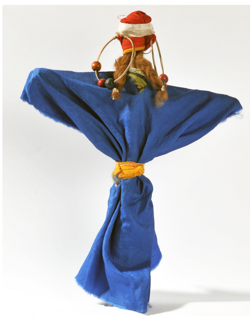
Tislit (jeune mariée), 1997, Collection Musée du jouet de Moirans-en-Montagne