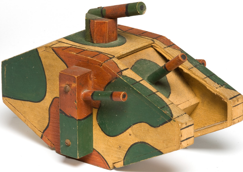
Le Stupéfiant, Les Créations Françaises du Jouet des Invalides, 1914-1918 Bois peint Paris, musée des Arts décoratifs