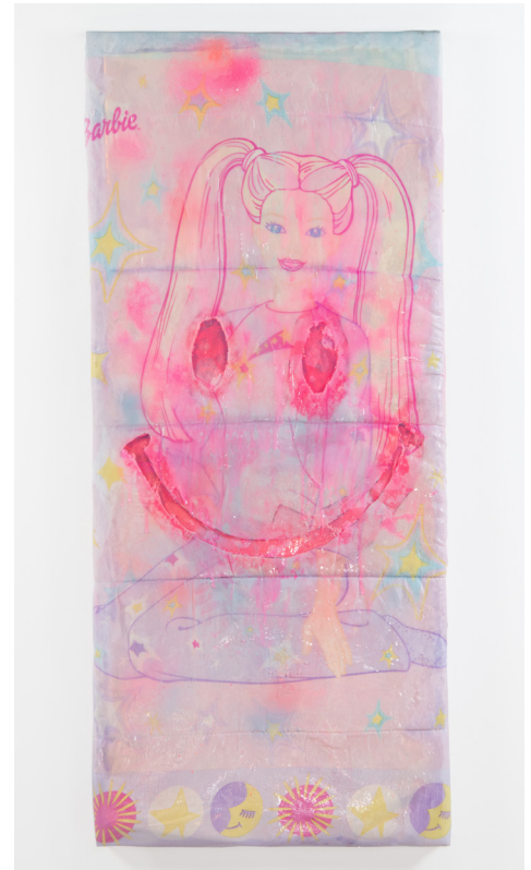
Tony Hope, Untitled (Barbie) , 2021