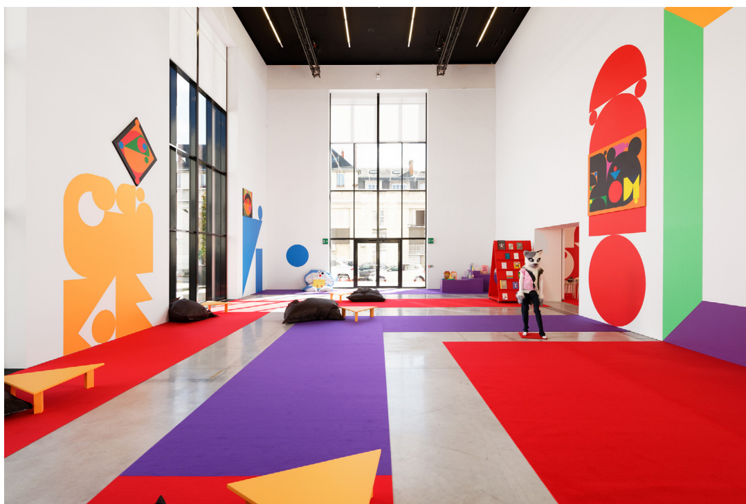
Ad Minoliti, Play Theatre, 2021, Centre de création contemporaine Olivier Debré