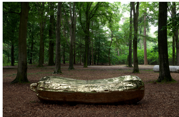
Sarah Lucas — Kevin, 2013 bronze © Sarah Lucas. Courtesy of the artist and Sadie Condon. Photo : Gert Jan van Rooij / Lustwarande, Tilburg

L'éveil des sens continue avec d'autres types de propositions, telle une création sonore exclusive réalisée en collaboration avec l'IRCAM et une exposition d'œuvres en Réalité Augmentée en collaboration avec Acute Art, leaders de la production d'œuvres en réalité virtuelle et augmentée (avec des œuvres de Tomas Saraceno, Olafur Eliasson, KAWS ou encore Alicja Kwade). En se promenant le long du bassin, les visiteur-ses peuvent tendre l'oreille partir à la découverte de différents environnements naturels, guidé-e-s seulement par les bruits des êtres qui les peuplent. 🟢