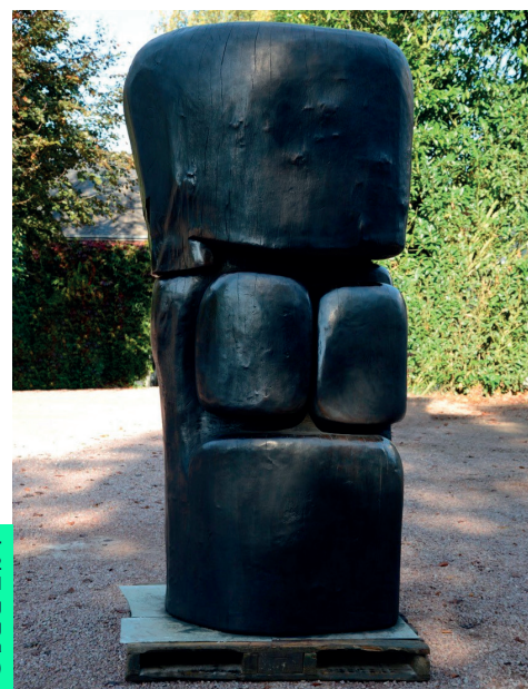
Wang Keping — Découverte, 2022 Bronze — Fonderie Bocquel