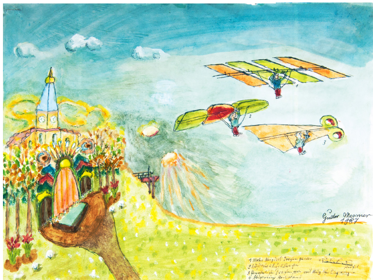
Gustav Mesmer — Mehr Steig Deck Drachengleiter "Different Kite gliders" Watercolor, Ink, Pencil and used paper. 1987 © Gustav Mesmer Stiftung

« Jamais rien n'égala le moment d'hilarité qui s'empara de mon existence, lorsque je sentis que je fuyais la Terre. [...] Puis je m'abandonnai à la vue que m'offraient les grandes masses de la nature et l'immensité de l'horizon. Je contemplais la vague de l'air et les vapeurs terrestres qui s'élevaient du sein des vallons et des rivières. Au milieu du ravissement inexprimable de cette extase contemplative, j'étais le seul corps éclairé dans les airs je voyais tout le reste du nature plongé dans l'ombre [...] J'interrogeais paisiblement toutes mes sensations. Je m'écoutais vivre pour ainsi dire. »