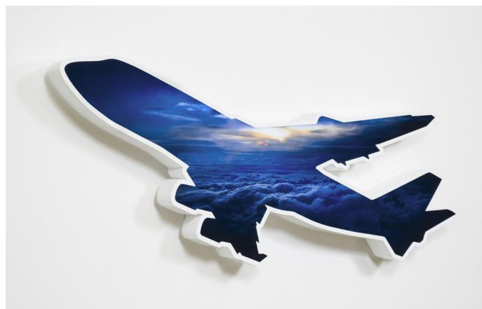
Doug Aitken — Cloud Plane

Marie-Laure Bernadac, commissaire de l'exposition