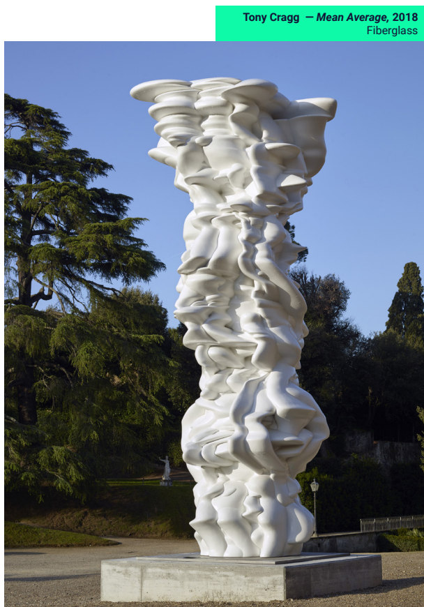
Tony Cragg — Mean Average, 2018 Fiberglass