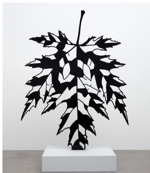
Simon Periton — Le Voleur, 2018 mild steel, zinc coating, paint, lacquer © Simon Periton. Courteoles HQ, London. Photo: Robert Glowacki